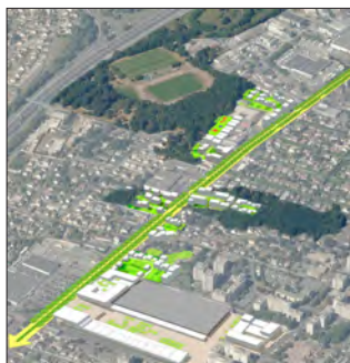
Projet de Montigny-lès-Cormeilles / Seura architectes.

Merci de nous prévenir si vous êtes inscrit et ne pouvez venir.