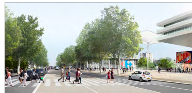
... à l'entrée en ville.