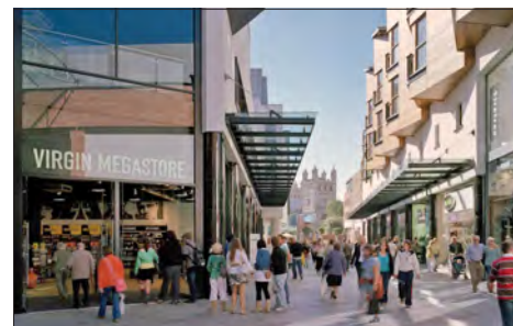
À gauche : Bull Ring, centre commercial de 32 ha qui répare les dommages de l'après-guerre au cœur de Birmingham.