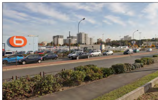
De l'entrée de ville...